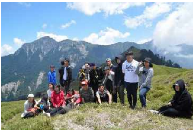
於合歡山進行環境課程

池南自然教育中心提供高中生的方案為「島嶼奏鳴曲」及客製化的「環境永續課程」。「島嶼奏鳴曲」以池南為基地，進行定向運動、復活島之歌、Home 影片欣賞及我的綠色行動等教育單元。「環境永續課程」則以高中班級的需求而量身設計，例如曾為花蓮海星高中策畫 2 天 1 夜的合歡山之旅，為桃園武陵高中策畫 3 天 2 夜的花蓮自然生態與人文之旅，讓學生們在山河大地中快樂地學習。