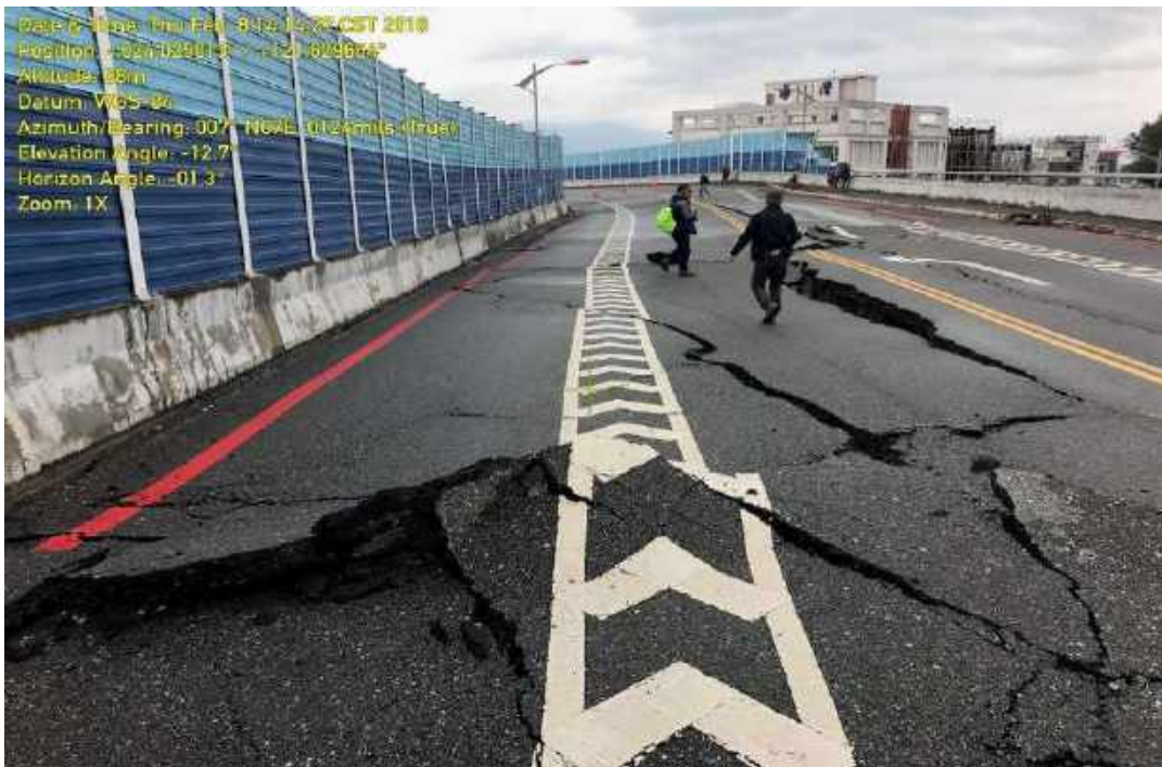
0206 震後的七星潭附近道路

所以花蓮市附近在百年之內受到多起災害地震的衝擊與影響。所以本次活動利用研究得到的關於地震、地表變形的資訊，帶領大家到七星潭附近觀察地震留下來的痕跡以及探討地震活動與長時間地質作用對花蓮市附近造成的影響。