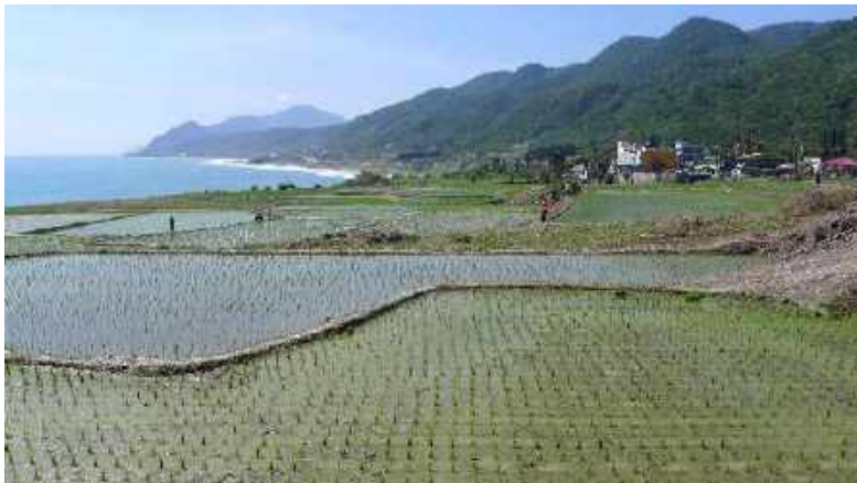
➤ 新社海階水梯田農業文化景觀

傳統上，相關主管機關容易本於各自的主管業務，傾向以單一社區或部落為服務對象，造成各個主管機關各自就部門的主管面向協助不同的部落。然而在地社區和部落的整體生產、生活和生態問題，必須在空間尺度和公私部門合作上採取跨域的協同治理模式，方能有效解決。2016 年 10 月，花蓮區農業改良場與東華大學合作，共同邀請花蓮林管處及水保局花蓮分局，與在地兩部落組成跨域（跨部門、跨社區）協同經營平台，發起花蓮縣豐濱鄉新社村「森-川-里-海」生態農業倡議，持續至今。