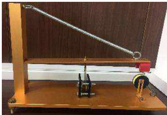
地震前兆園區與地震儀