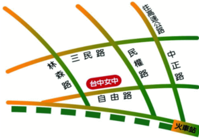
臺中市立臺中女子高級中等學校 110 學年度校園配置圖

※校內不開放停車，請搭乘大眾運輸工具到校。若有需開車至該校之老師，請將車輛停放至鄰近該校之平面停車場或週邊道路停車格。